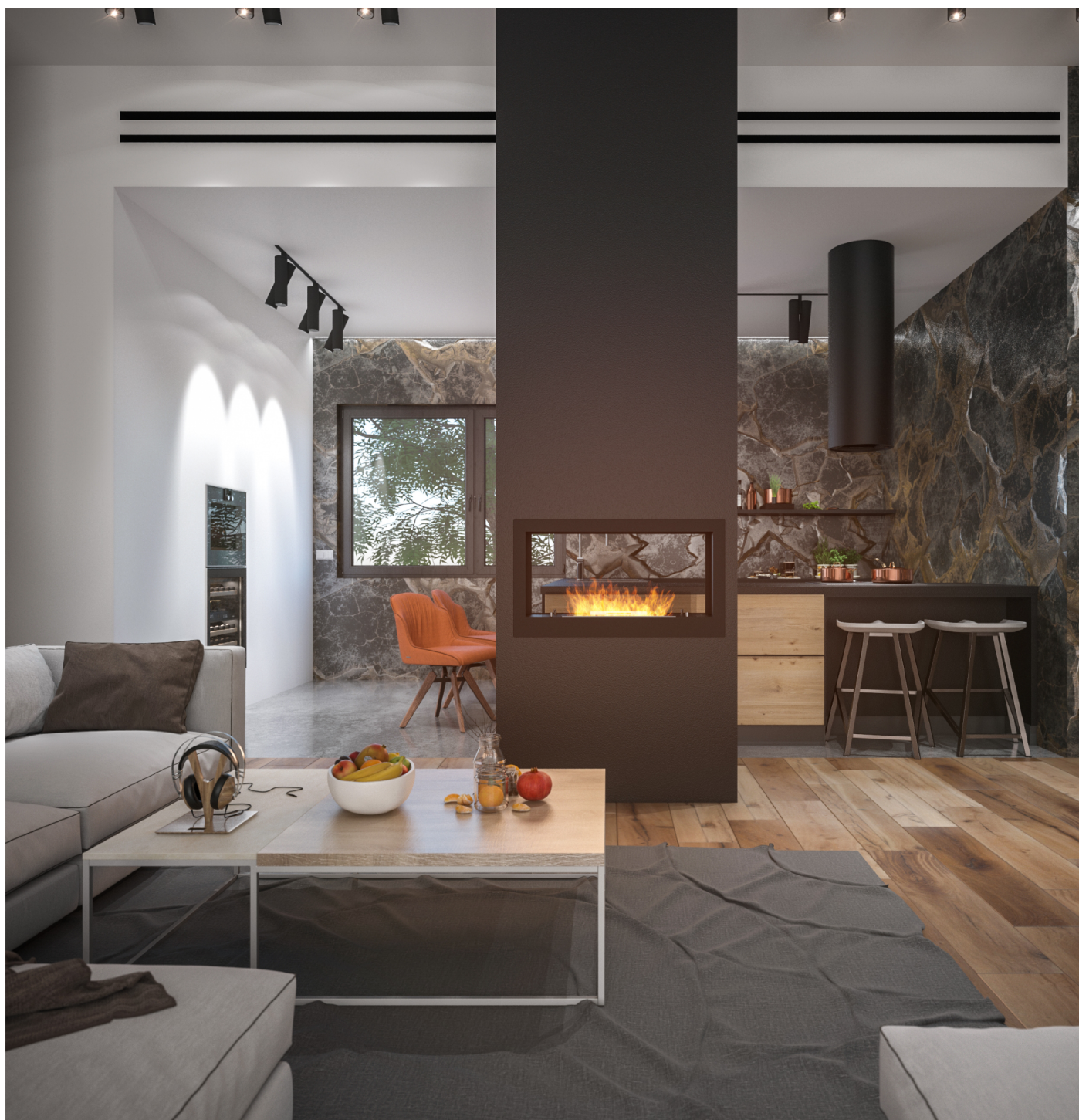
Biokominek 2 Side 900