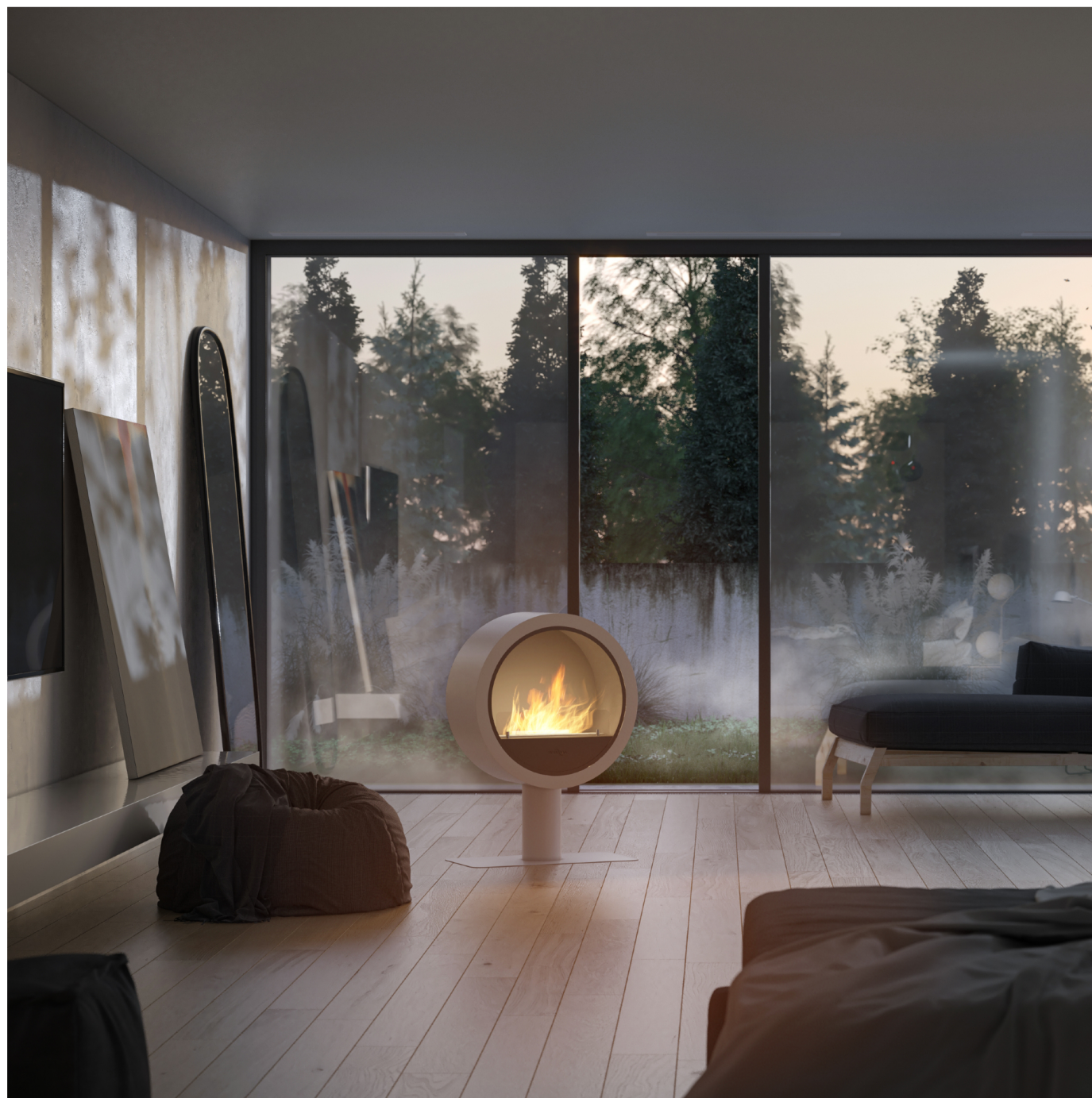
Biokominek Incyclle Stand