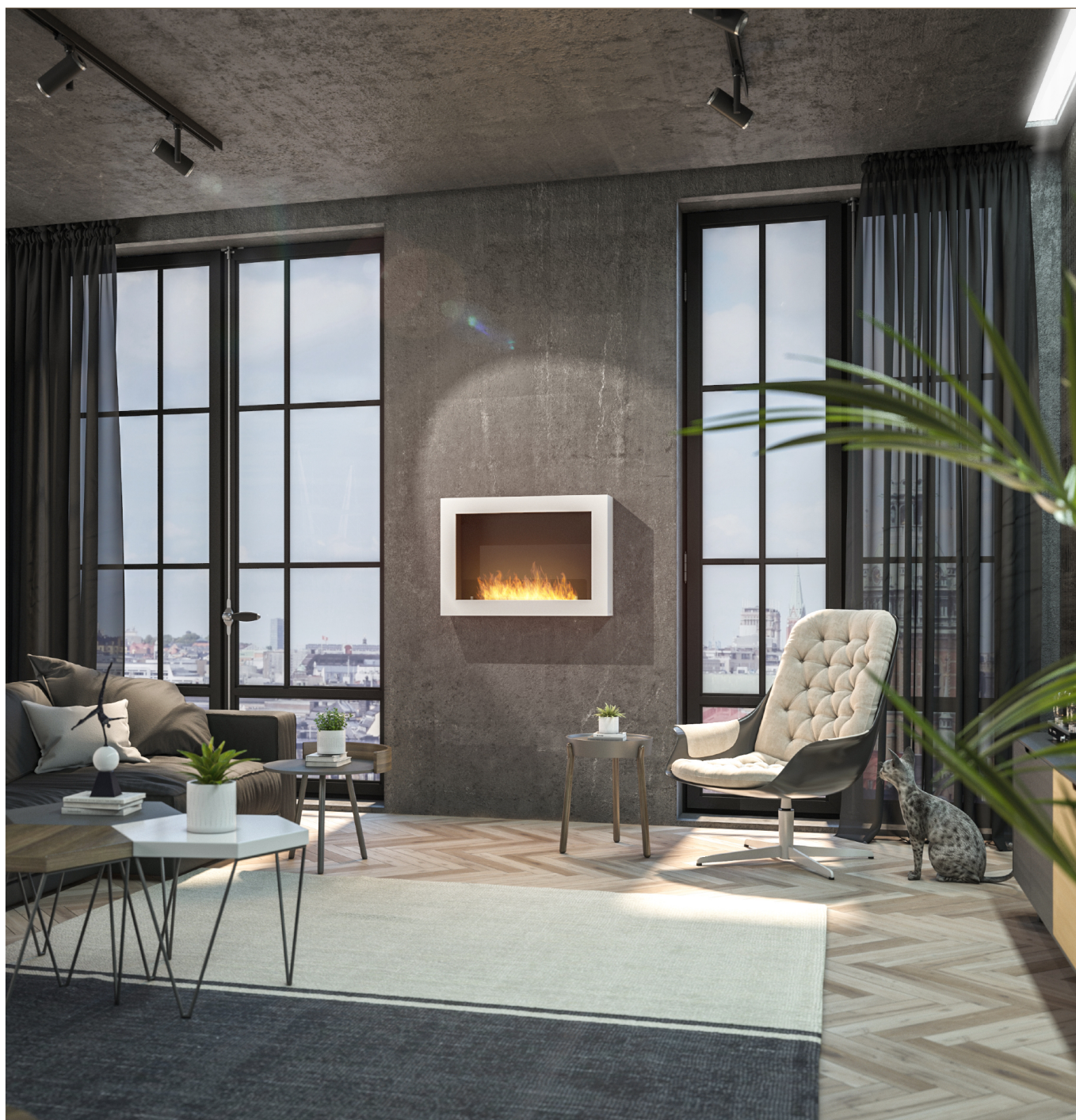
Biokominek Murall 800