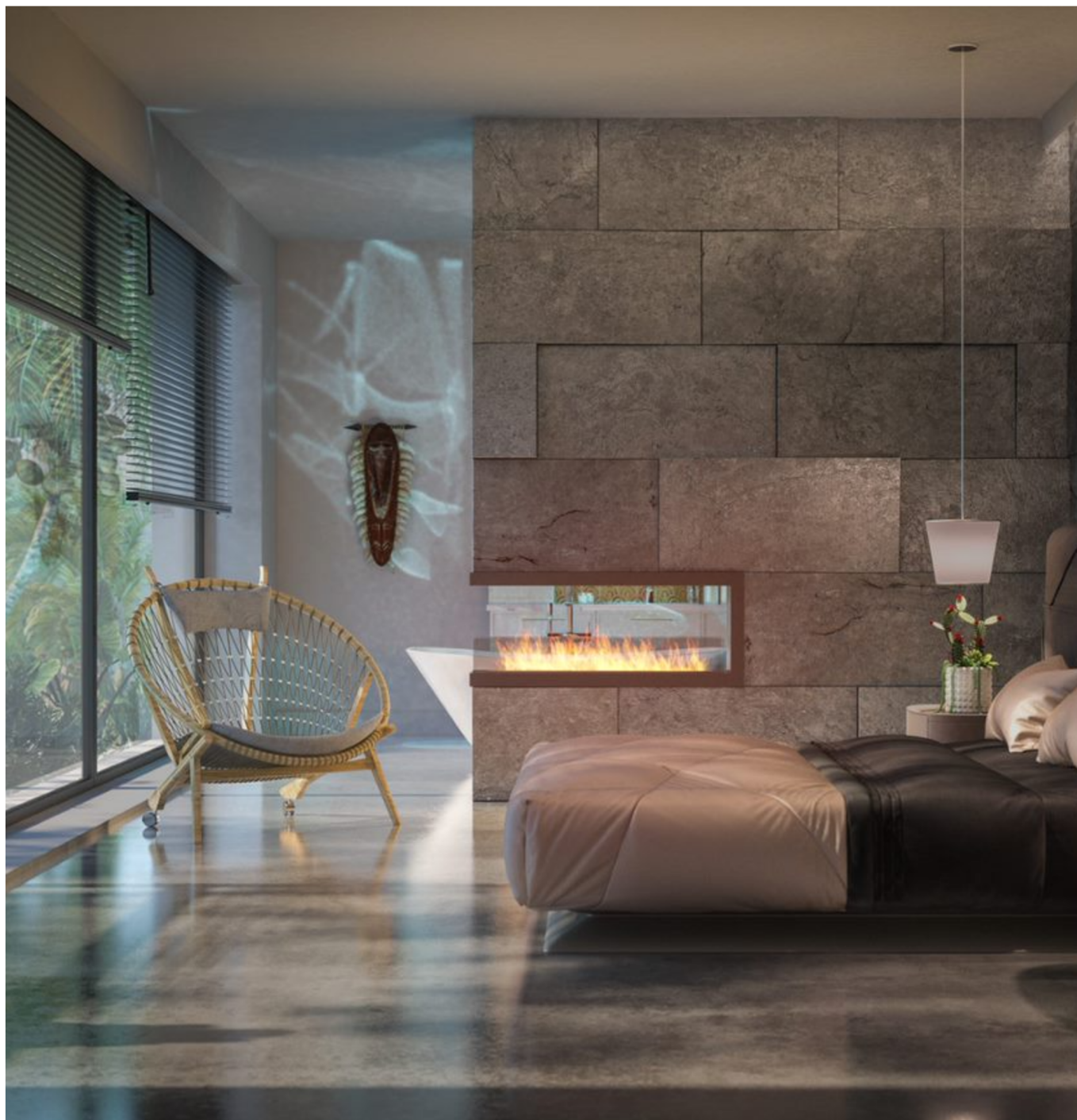
Biokominek Inside U1200