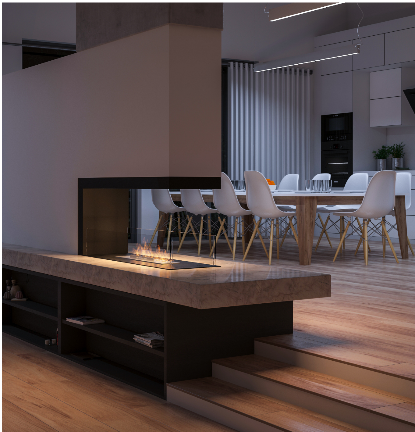
Biokominek Inside U1000.1