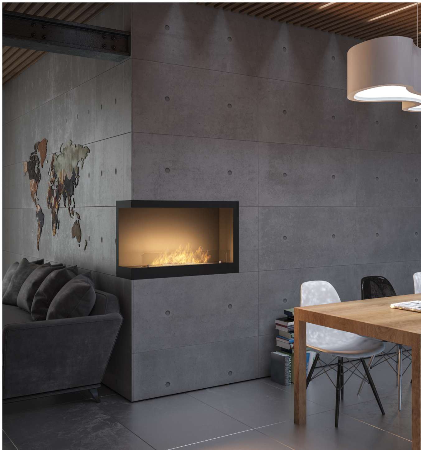
Biokominek Inside L800v1