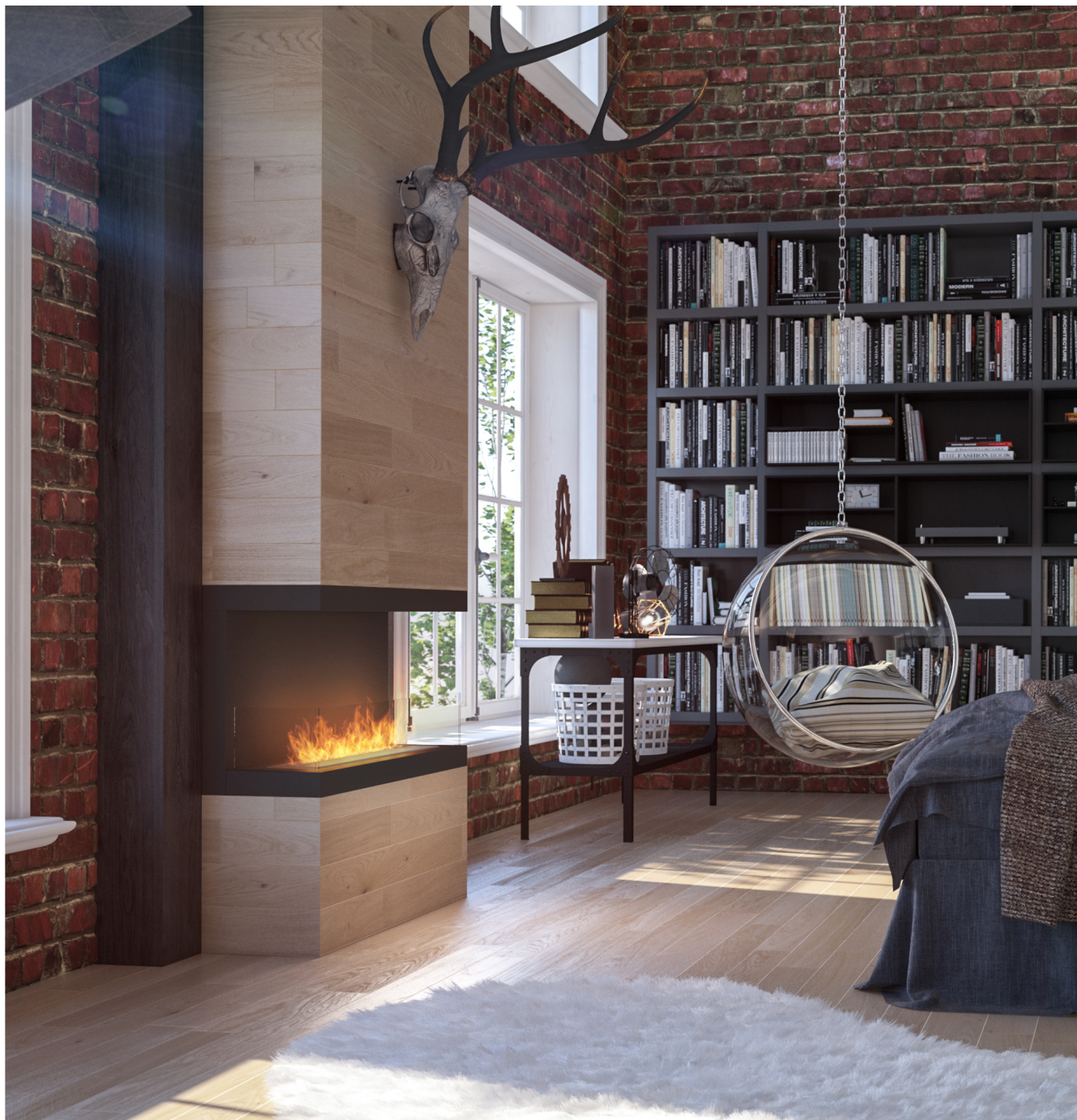
Biokominek Inside C1000v3