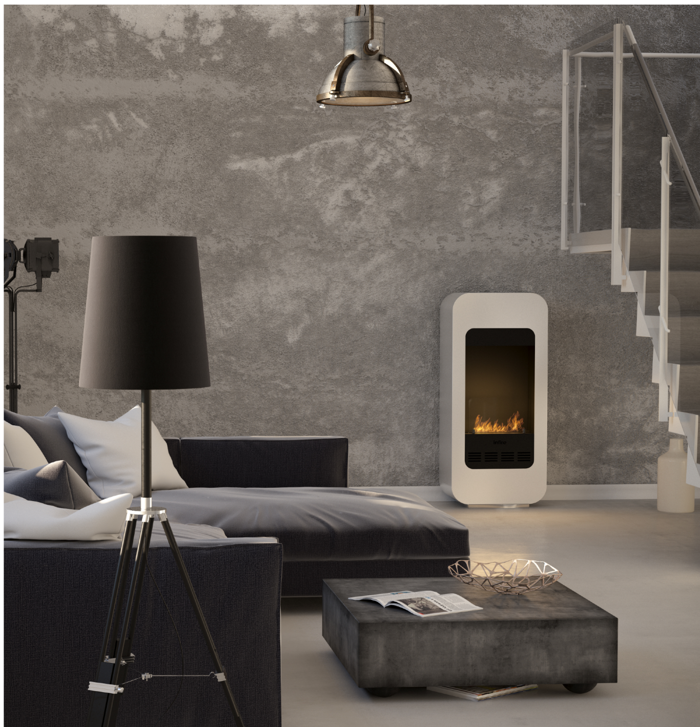
Biokominek Empire 2